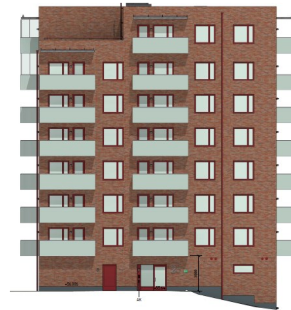
Fasad mot öster med entré mot T-banestationen