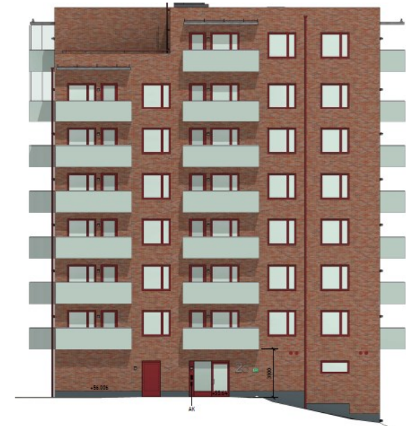
Fasad mot öster med entré mot T-banestationen